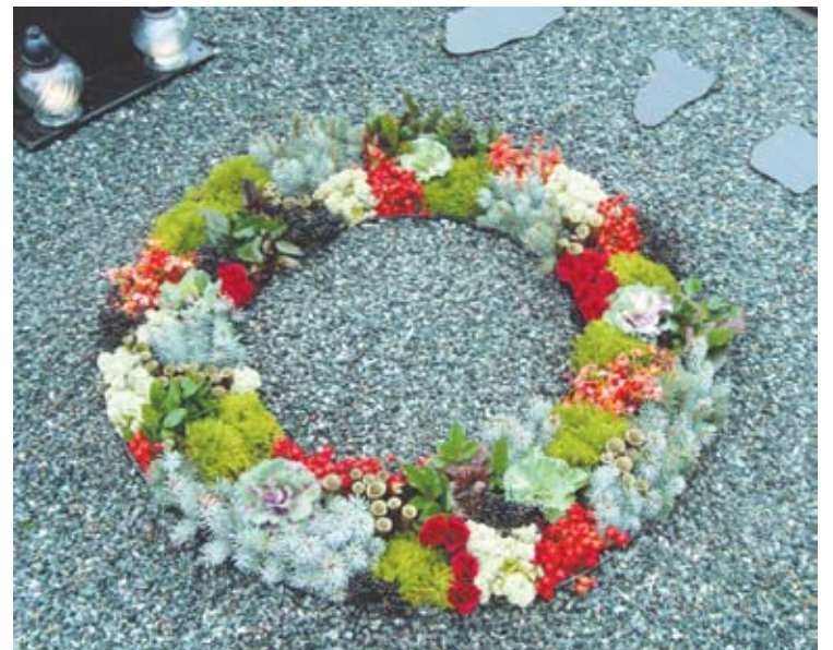
Vieta antkapio - vainikas iš augalų ir uogų.