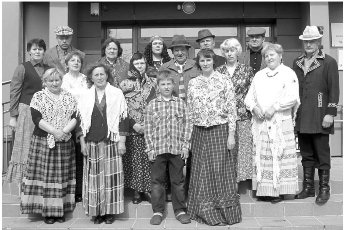
Traupio mėgėjų teatro aktoriai po spektaklio „Praeitin sugrįžus“ prie Traupio kultūros namų.