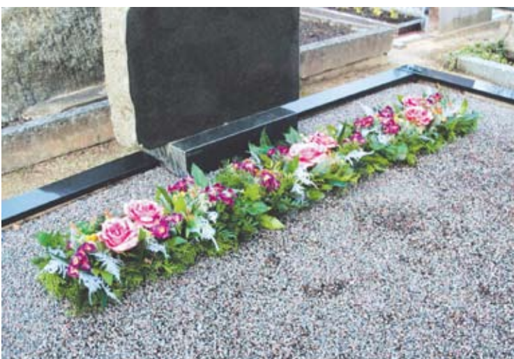
Kukli augalų juostelė prie paminklo su dirbtinėmis gėlėmis išsilaikys ant kapo visą žiemą.