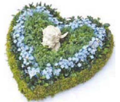
Sentimentalūs simboliai - širdies formos vainikas, liūdinčio angelo statulėlė, neužmirštuolės ant kapo gali atrodyti gerai ir stilingai.

„Kad ruduo turėtų kažkokios didelės įtakos pirkėjų pasirinkimui – nepastebėjau. Populiariausios išlieka rožės: kaip visame pasaulyje, taip ir pas mus, – teigė floristė ir pridūrė, – rudenį populiariausi jurginai,