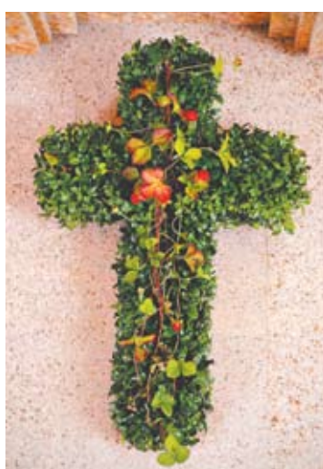
Įdomiai atrodo kryžius iš augalų.