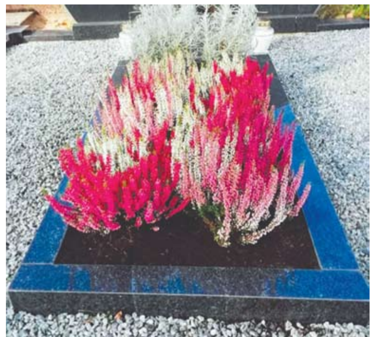
Viržiai – vieni populiariausių augalų kapams puošti. Jie nebijo nedidelių šalnų ir net apšalę atrodo estetiškai.