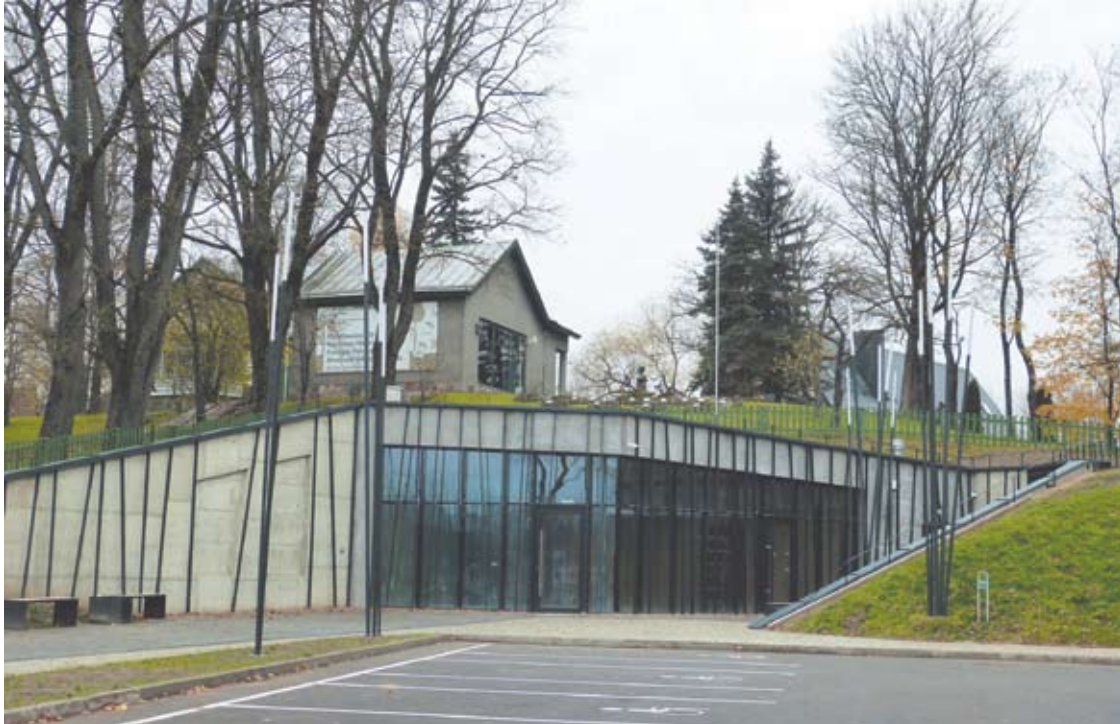
Buvusių Anykščių turizmo informacijos centro „kioskų“ vietoje įsikurs Lankytojų centras.

Yra numatytos patalpos, kurios bus išnuomos kavinei, o didelė dalis komplekso patalpų po konkursų be nuomos mokesčio bus skirta anykštėnams.