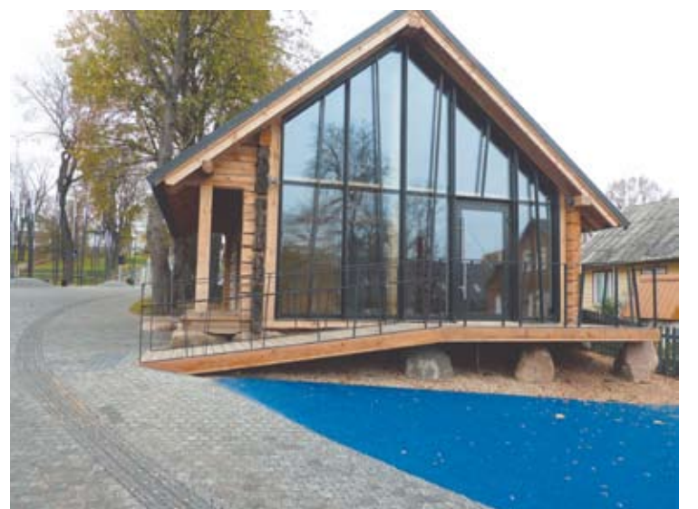
Sena klėtis virto stikliniu namuku.