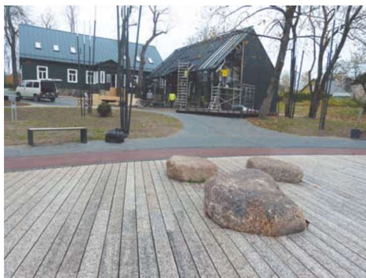
Šiomis dienomis Tilto gatvėje dar dirbo statybininkai.

ir tėvai, ir seneliai, ir kaimynai“, - kalbėjo vicemeras.