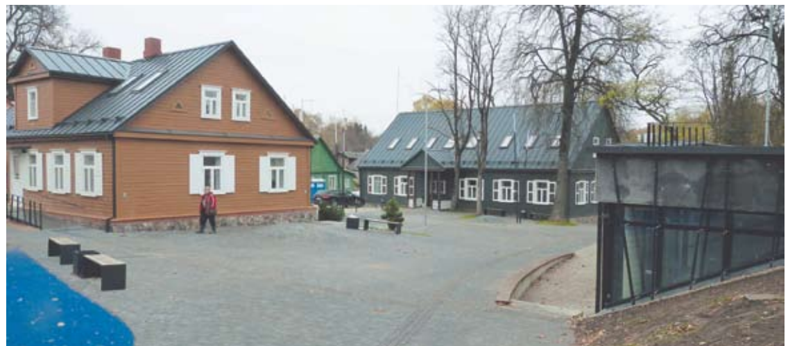
Rekonstruotuose Tilto gatvės namuose dalis patalpų bus skirta smulkiesiems Anykščių verslininkams.

sakė, kad per Kalėdų eglės įžiebimo ceremoniją, gruodžio pradžioje, kompleksas turėtų būti jau atviras lankytojams. „Jeigu į kiekvieną kabinetą pavyks pasodinti po grojantį vaiką, ateis